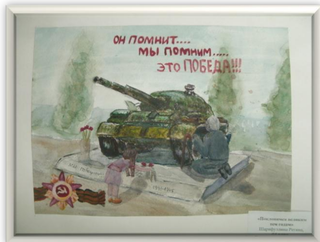
Гомыжев Леонид 7А